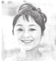
女優・介護士 北原佐和子

1964年3月19日埼玉生まれ。1982年歌手としてデビュー。その後、映画・ドラマ・舞台を中心に活動。その傍ら、介護に興味を持ち、2005年にヘルパー2級資格を取得、福祉現場を12年余り経験。14年に介護福祉士、16年にはケアマネジャー取得。「いのちと心の朗読会」を小中学校や病院などで開催している。著書に「女優が実践した魔法の声掛け」