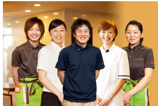
個別のニーズに柔軟に対応するスタッフ体制を構築