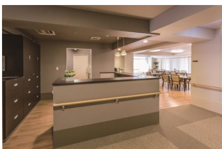
見守り重視のヘルパーステーション