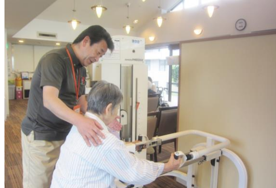
理学療法士による個別訓練の実施