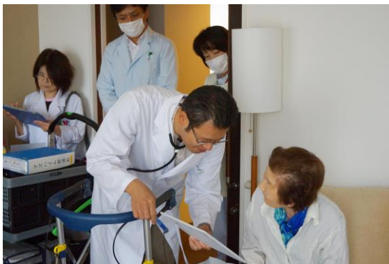
協力医療機関による訪問診療