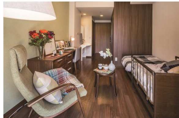
丹沢の樹木の緑をイメージした 居室

11月2日にて弊社アズパートナーズは創業10年を迎えます。これから先の10年も設立以来培った経験を活かし、【お客様のニーズに応える】【質の高いサービス提供】をモットーに、ご入居者の方々に安心してご利用いただけるようサービス提供してまいります。弊社の更なる活躍にご期待ください。