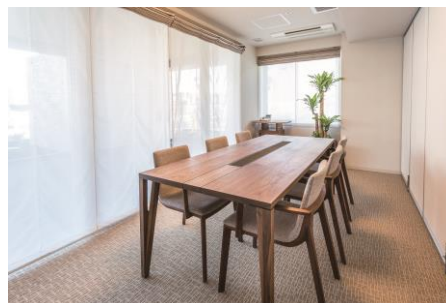
多様性を考慮した相談室