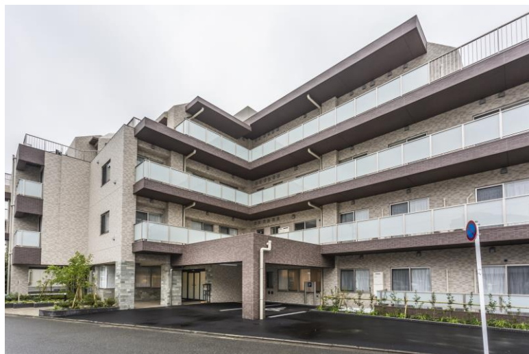
アズハイム町田 建物外観