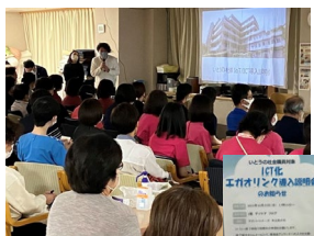
2023年10月 導入前全体説明会 約80名のスタッフが参加されました。