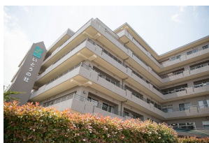
介護老人保健施設 いつもの杜