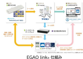
EGAO link® 仕組み