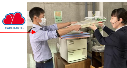
記録ソフトの導入により紙面でのチェック表が不要になったため、 収納ケースともお別れすることになりました